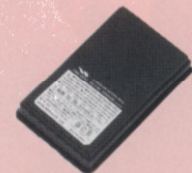
リチウムイオン電池パック(1600mAh) FNB-V67LI 継ぎ足し充電ができるリチウムイオン電池パック(付属品と同等)