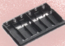
単3アルカリ乾電池用ケース FBA-25 単3アルカリ乾電池6本用の電池ケース。受信が多い場合や、リチウムイオン電池がすぐに充電できないときの予備用に最適です。