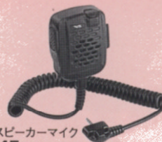
外部スピーカーマイク MH-45B4B 屋外業務に最適な大音量タイプの外部スピーカーマイク。