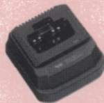
急速充電器 VAC-810A 空になったリチウムイオン電池パックを約1.5時間で充電する急速充電器。電池パックは単体/無線機装着時どちらも充電が行えます。