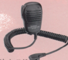
外部スピーカーマイク MH-34P4B 防沫タイプの小型スピーカーマイク。